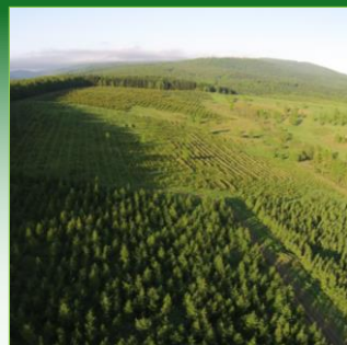
森林資源の保全・管理に関する事業